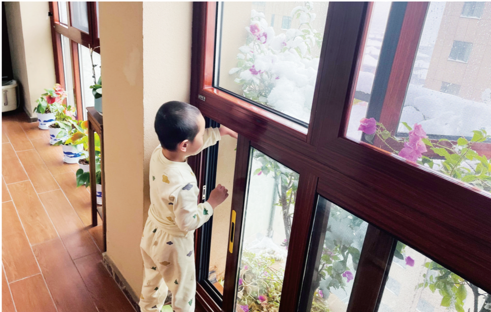
▲春天里业主实拍图。

“中国将力争2030年前实现碳达峰,2060年前实现碳中和。”实现碳达峰、碳中和,不仅是国家层面的战略决策,更是与我们每个人的生活息息相关。