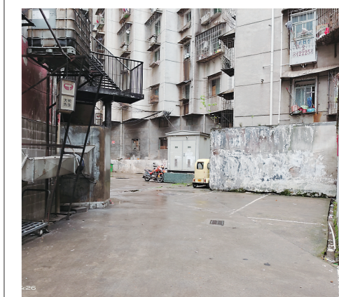
▲划线部分为小区新规划的充电桩安装点。

经协商,华茂大厦后坪权属人同意腾出两个车位,无偿提供20平方米的面积给华茂大厦居民用于安装10个充电桩。昨日,记者在现场看到,小区新规划的充电桩已划线,接下来将进入施工阶段。