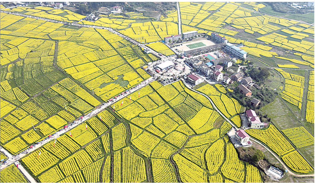
▲航拍茶陵县秩堂镇万亩油菜花盛开。

本报讯(株洲晚报融媒体中心/周蒿)上周,天气晴好,株洲各地的油菜花、樱花、桃花等都进入了盛花期,引来无数游客徜徉花海。火爆的人气,也激发了乡村经济活力,农家乐、民宿等随之火热。