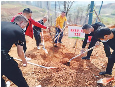
▲植树行动也体现了浙商的团结协作精神。

本报讯(株洲晚报融媒体中心/王鸿 通讯员/易潇 曲宏)“坑还要挖深一点,否则树栽不稳!”3月19日上午,在热火朝天的博古山公园“我在株洲有棵树”植树现场,一支干劲十足的队伍格外显眼,他们就是浙江商会党支部的义务植树队。