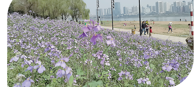
▲河西湘江风光带钢琴广场处的郁金香花海。