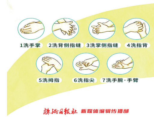
株洲日报社 新媒体编辑传播部