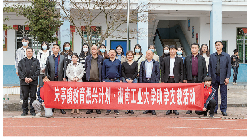
“朱亭镇教育振兴·湖南工业大学助学支教”启动仪式现场。