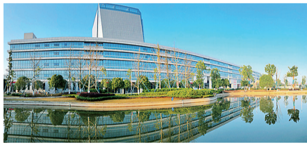
湖南汽车工程职业学院。

榜单,今年湖南汽车工程职业学院全国综合排名上升10位、理工类上升7位,中部排名上升2位,全省排名上升1位,综合竞争力位居株洲高职院校第一。 2021年,湖南汽车工程职业学院直面疫情防控的新考验、全国全省职教大会指引的新征程,各项工作都有了新进展新突破:推进党建引领凝心铸魂,党史学习教育对标对表,通过验收全国样板党支部1个;落实立德树人根本任务,承担教育部“思政教育联合行动”的思政素养评价项目1项,获评全国活力团支部1个;筑牢教学科研发展根基,立项国家级教师教学创新团队1个,获全国优秀教材一等奖1个,被省厅推荐参评国家规划教材8部,立项纵向课题国家级4项,获批国家级科普基地1个;促进学生成长成才,学生参加省级及以上创新创业大赛获奖16项(国家级一等奖7项、二等奖6项、三等奖5项);毕业生初次就业率达90.18%,就业工作被国家教育部点名表扬,学院荣获“湖南省文明标兵校园”“湖南省平安校园示范校”。