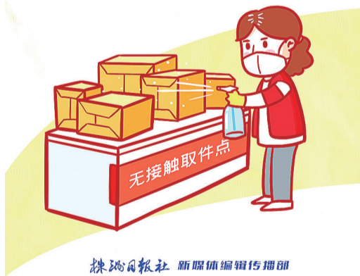
株洲日报社 新媒体编辑传播部