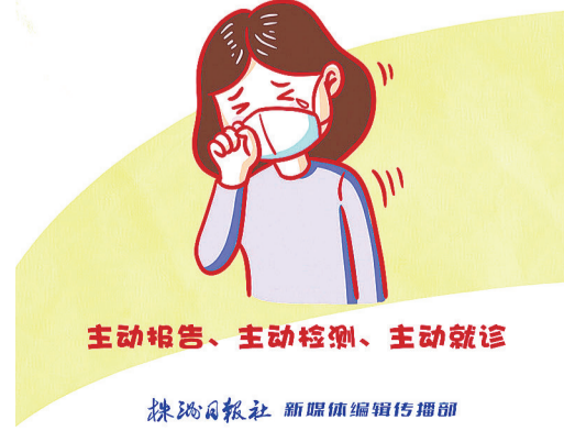
株洲日报社 新媒体编辑传播部