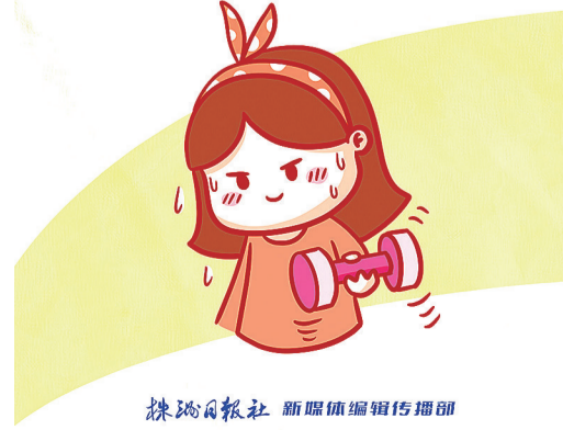
株洲日报社 新媒体编辑传播部