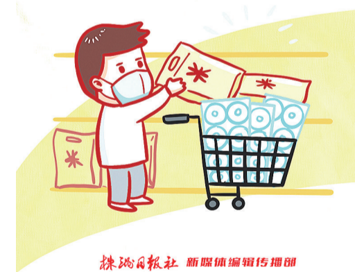
株洲日报社 新媒体编辑传播部