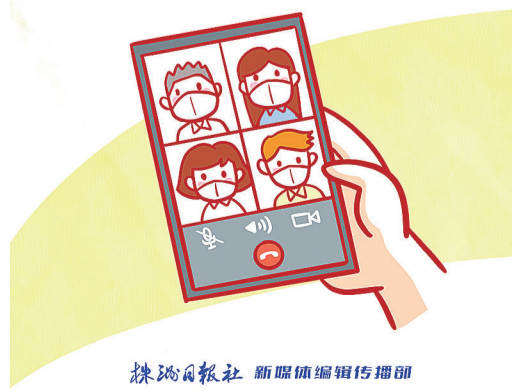
株洲日报社 新媒体编辑传播部