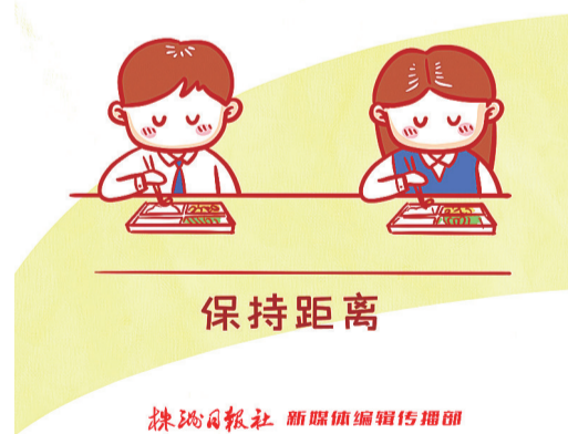
株洲日报社 新媒体编辑传播部