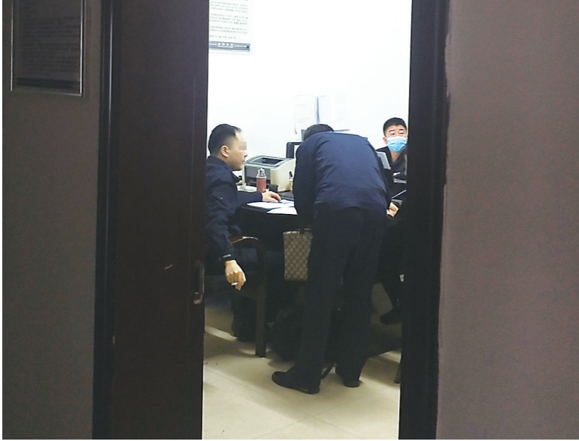
▲芦淞交警大队事故接待三室,工作人员未佩戴口罩。

在芦淞区交警大队办公楼入口处,工作人员按要求对进入大楼的市民进行测温、扫码。在一楼的交通处罚大厅,4个窗口的工作人员均按要求佩戴了口罩,办理交通处罚业务的市民被要求叫号进入大厅。位于二楼的事故内情室和事故接待三室各有1名工