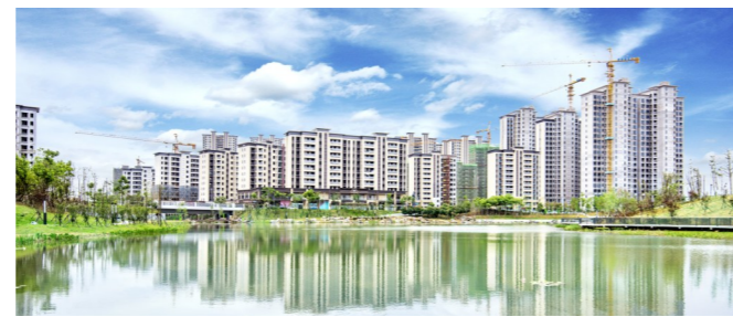
绿地株洲城际空间站实景图