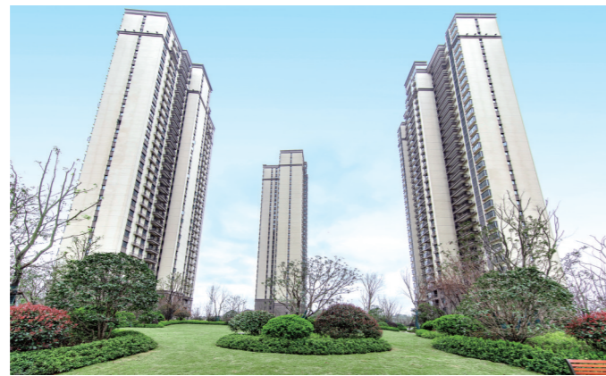
中建玥熙台小区实景图

此次中建玥熙台28栋未推先火,不仅是产品本身品质过硬,更离不开整体项目的优越实力。