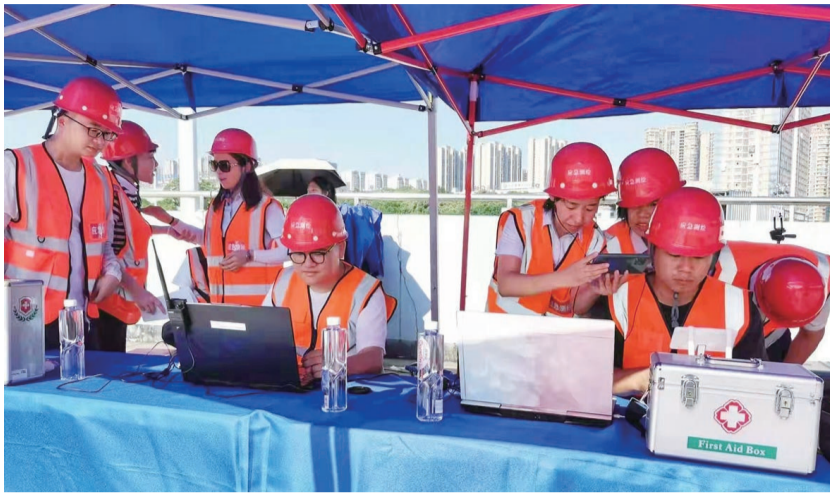
现场采集制作地理信息图。

此外,我市还将全面实现城市实景三维与空间规划的深度融合,加快建设国家新型基础测绘建设株洲市试点,为重点项目提供精准服务。