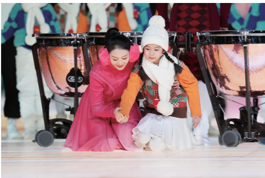
▲这是闭幕式上的表演。