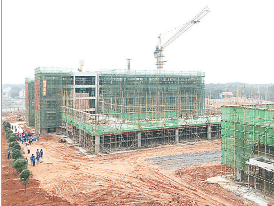
▲新校区3栋、4栋教学楼已经封顶。

本报讯(株洲晚报融媒体记者/戴凇)记者昨日从相关部门获悉,株洲铁航卫生学校新校区3栋、4栋教学楼已经封顶,其他部分也在加紧建设中。按计划,新校区将于今秋开学投用。