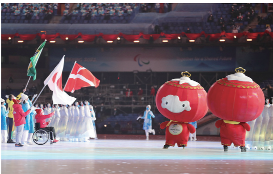
▲这是闭幕式上的北京冬残奥会吉祥物“雪容融”。