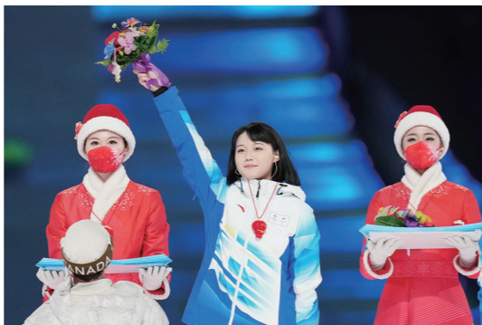
▲这是闭幕式上的向志愿者致谢环节。