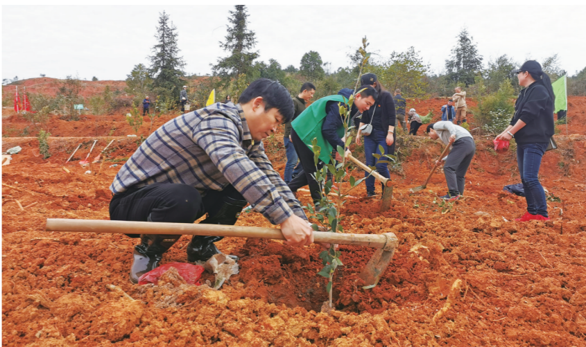
种下一株油茶苗。

株洲日报·掌上株洲讯(记者/王军 通讯员/周轩 杨传春) 新绿又在株洲的土地上扎下了根。3月10日,在天元区三门镇松柏村义务植树基地,28家市直机关单位干部职工,纷纷涌上山头植树。据林业部门统计,当天参与植树的干部职工近3000人,栽种树苗超过3万株。