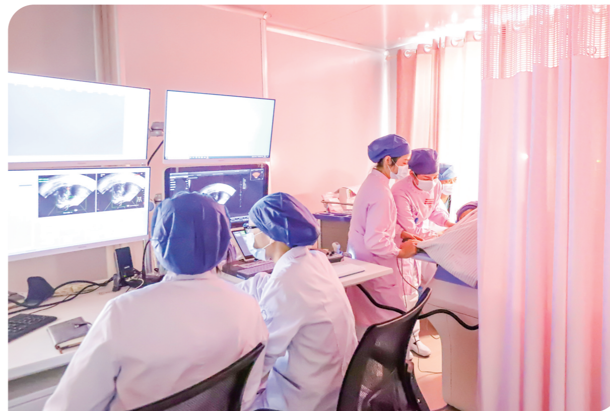
▲舒适的海扶微创治疗中心。

很多女性患上子宫肌瘤、子宫腺肌症等疾病以后,都面临着开腹或腹腔镜切除痛体,甚至子宫切除手术。一想到要在无影灯下,身插管道,听着各种手术器具叮咚作响,术后,还要面对漫长的手术恢复期,大家的恐惧就涌上心头。