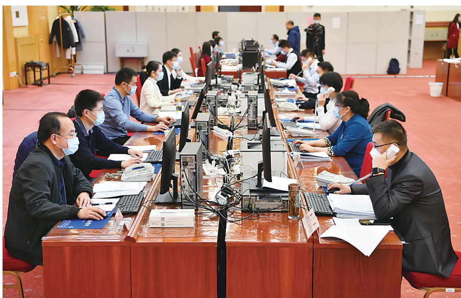
▲3月9日,十三届全国人大五次会议秘书处议案组建议小组的工作人员在工作,代表建议在这里批分处理后确定承办单位。