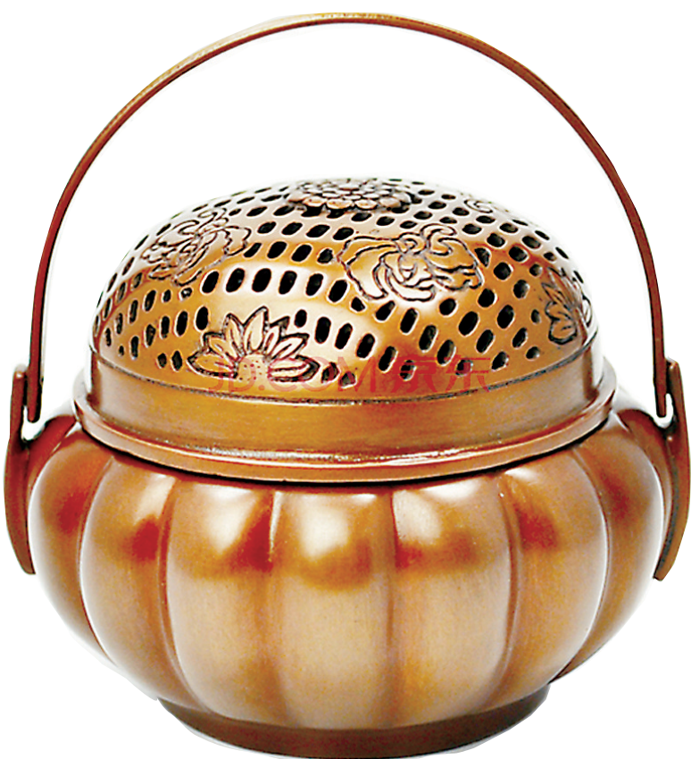
▲作者收藏的宋代紫铜暖手炉。

过去的读书人,冬天在书房里读书,手脚会很冷,以致妨碍书写绘画。官宦贵人,冬天上街门办公或出门访友,乘车坐轿也不能烤火取暖,于是有人设计了一种专门捧在手上取暖却不会烧坏周遭物品的手炉。相传隋炀帝沿运河南巡至扬州,时值隆冬时节,江都(今扬州市)县令为接驾,急命