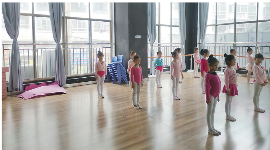
▲小学生在参加舞蹈培训。