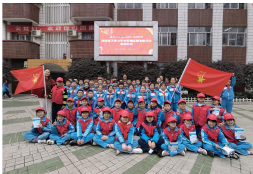
▲“雷锋家乡学雷锋”活动启动仪式现场。