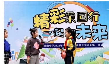
▲开学典礼上,孩子们的精彩表演。

将垃圾分类知识与舞台情景表演相结合,让大家在欢乐的氛围中也学习了环保知识。当日,该校特色德育作业中的部分寒假优秀实践作品也得以在舞台上展现,除了具有传统特色的对联、心灵手巧的同学们还精心制作了许多可爱的老虎头饰、老虎贴画等。