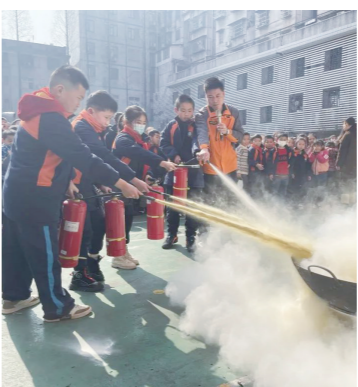
▲荷塘小学消防演练场景。

的方法,也演示灭火器的正确使用方法,并让学生体验使用灭火器扑救初期火情。为了让消防知识更深入人心,消防安全宣传员还特地带来了防毒面具,在现场手把手教孩子们如何规范使用,让孩子们零距离地接触消防、学习消防和体验消防。