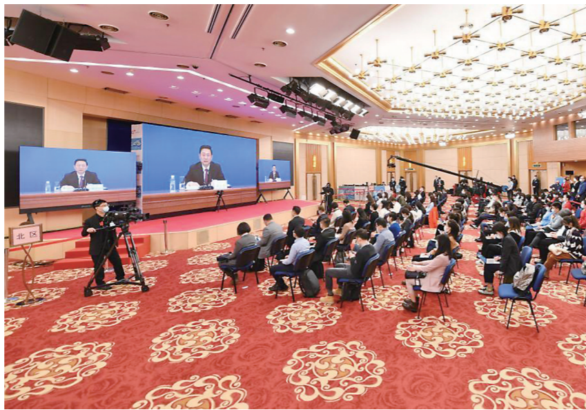
▲3月3日,全国政协十三届五次会议新闻发布会在北京举行,这是记者在会场参加发布会。

郭卫民认为,解决就业问题需要政府、社会、企业以及准备就业的年轻人等各方面的共同努力。