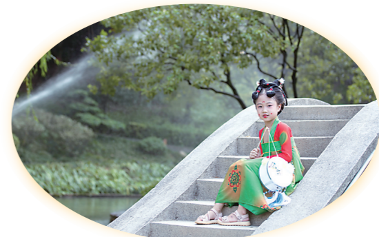
▲受十里的影响,她的女儿也成为汉服迷。

以前,汉服还是小众爱好,只有在“同袍”聚会时才能见到汉服的身影。2016年至2019年,汉服文化快速扩张,并在2020年成功“破圈”,记者搜索发现,B站汉服频道视频累计播放量达21.9亿次,抖音、微博等平台也成为汉服文化的传播阵地。