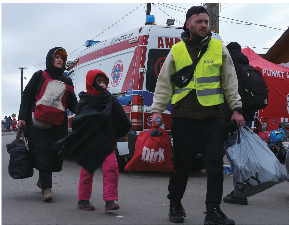
当地时间2月28日,一名志愿者陪同来自乌克兰的人们离开波兰梅迪卡口岸。