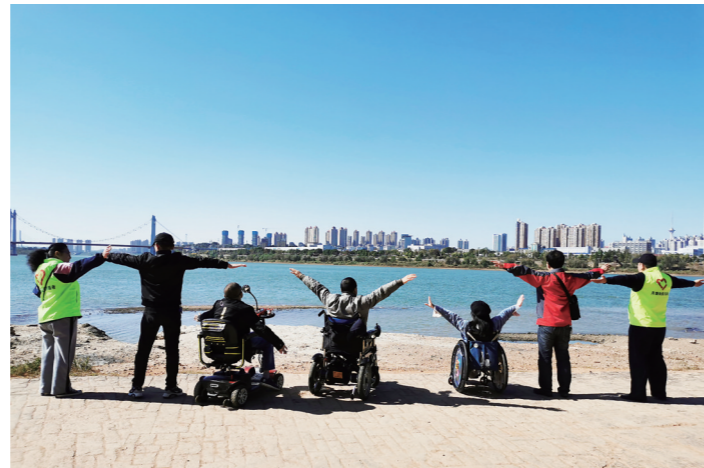
▲“星火相传”志愿者开展活动,引导残障朋友互帮互助。

目前,“星火相传”有11名残障志愿者携手30余名党员、社区志愿者,在街道和社区的指导下,为服务对象及家属提供生活、心理、精神、物质等方面的服务。