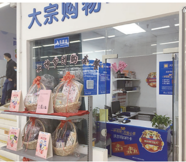
▲沃尔玛超市,母婴室与办公室共用场地。

本报讯(株洲晚报融媒体记者/刘平)“没有指示,找母婴室不方便。”2月27日,市民练女士拨打本报热线28829110反映,她的女儿即将休产假,要回神农太阳城上班,但商场内的母婴室不好找,让她感到担忧。