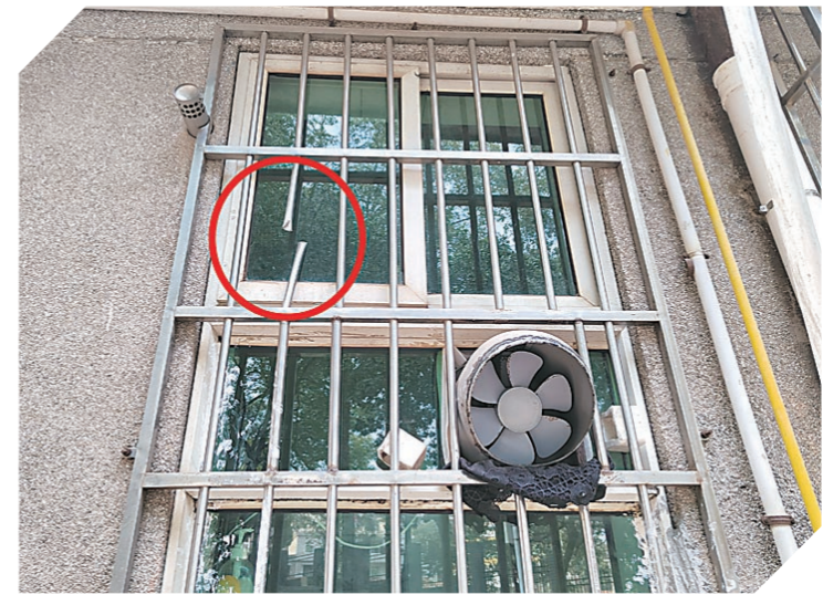
▲小区住户家中被盗痕迹。