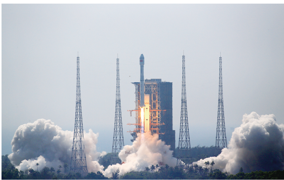
图为发射瞬间。