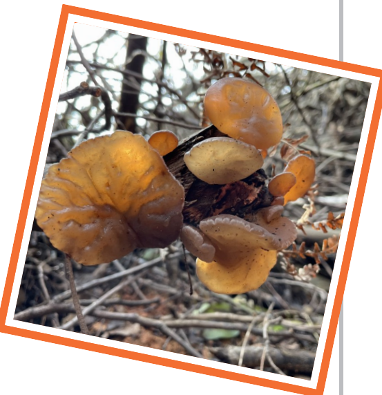
肥美的野木耳是山野春的味道。

郊区的田野也是大伙寻找春季美味的主战场。去仙霞岭扯水芹,是不少人每年的固定节目,到九郎山采蕨,是春日里少不了的团建。不过,有无野菜,都无须太刻意。只要春光好,走进田野乡村,总能寻到惊喜。