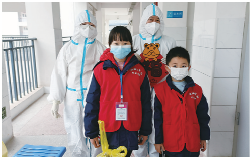
▲芙蓉学校校园记者送“福”给白衣天使。

班主任们精心装扮黑板,用粉笔画着写上寄语,还为同学们准备抽红包惊喜,祈盼着同学们天天向上地成长。