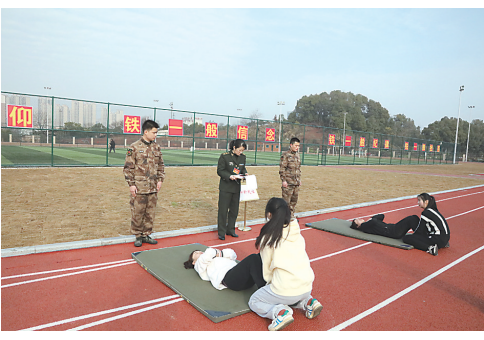
▲女青年参加测试。

我爱我的家。爸爸妈妈都很爱我,我也很爱我的爸爸妈妈。爸爸为了养家,日夜奔波,辛苦工作。妈妈也尽心尽力的照顾着我们全家。我爱我的家,希望我们全家人都能健康快乐每一天。