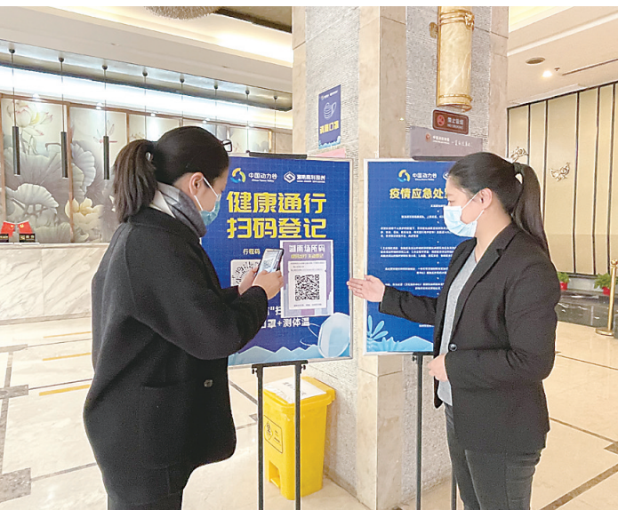
▲市民扫码进入场所。

本报讯(株洲晚报融媒体中心记者/刘琼 通讯员/朱卫健)当前新冠肺炎疫情形势严峻复杂。2月25日,记者从市卫健委获悉,为进一步做好疫情常态化精准防控工作,即日起,市民出入重要场所需要扫描“场所码”。