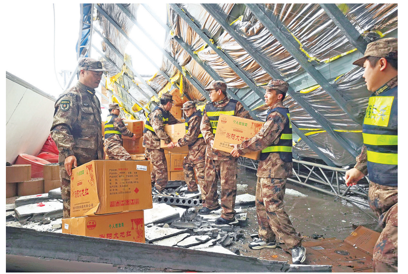
民兵接力搬运坍塌仓库内货品。

现场,在有坍塌风险区域,民兵队伍冲锋在前,联合企业员工,采取木柱加固、钻孔排水、抬移破塌墙板等方式,搬运货物。经过4个多小时的紧张作业,所有烟花爆竹被成功转移。