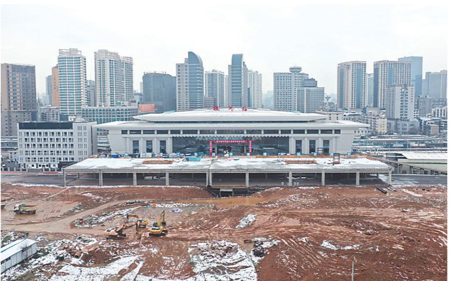
▲建设中的株洲火车站东站房。

本报讯(株洲晚报融媒体中心记者/廖明 通讯员/余倩倩)对于拥有百年历史的株洲火车站来说,因为改扩建施工,2022年春运,是一次不得已的错过。春运已近尾声,火车站改扩建项目进展如何?市民何时能在全新的火车站乘车? 2月23日,记者深入项目施工现场,从中铁建工集团株洲站改扩建工程项目经理王育凯口中,得到