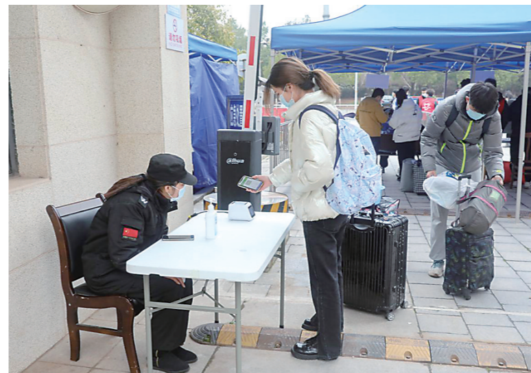
▲湖南铁科职院2021级学生入校扫健康码。

本报讯(株洲晚报融媒体中心/徐孜 通讯员/陈祖康 许雨萱)“请大家戴好口罩,排好队,检测体温后往前走。”“请