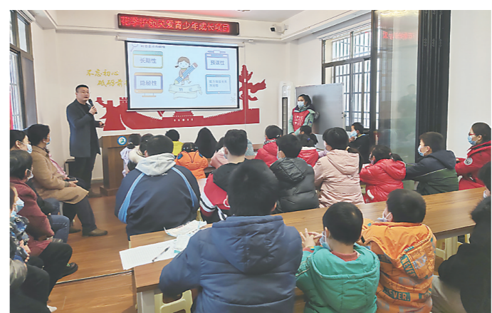
▲律师为青少年和家长们讲授开学第一课法治课。

本报讯(株洲晚报融媒体中心/向胤蓉 通讯员/廖婷)2月20日,荷塘区月塘街道城乡帮困项目、蒲公英社会工作服务项目联合湖南金州(株洲)律师事务所开展“送法到身边”活动,引导广大青少年树立法治观念,提高法律意识,积极落实“我为群众办实事”实践活动。