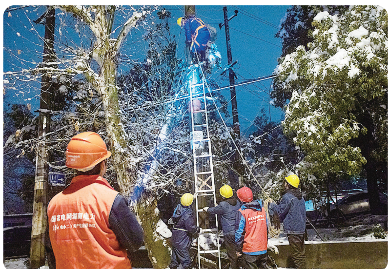
抢修人员正在连夜修复供电设施。

一整晚,抢修队员们全部出动,奔赴各个停电区域,逐一查找故障点,顶风冒雪紧急开展抢修。截至23