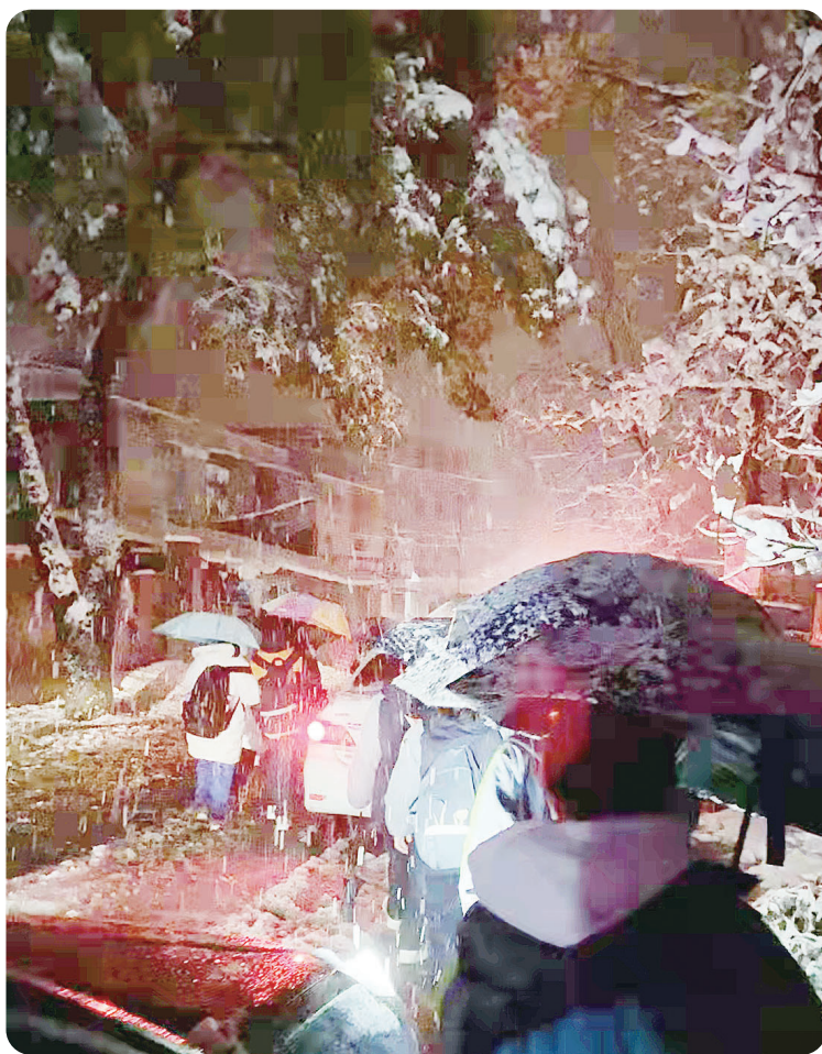
在老师们的带领下,同学们排队步行。

新庚、钟子煦、陈一萱老师都是“90后”,他们分布在队伍的前、中、后三段,分别照着9名同学。同学们则手牵着手,防止滑倒。