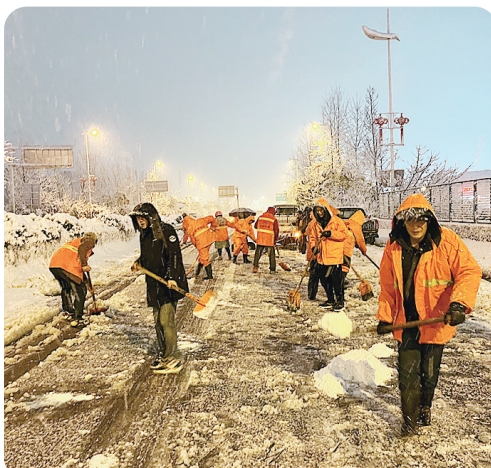
城管党员先锋队正在迎击大道铲雪。

2月23日一大早,风停了,屋顶上的积雪又厚了几分,但出行的道路却比大家想象中的洁净通畅,这是奋战的力量。