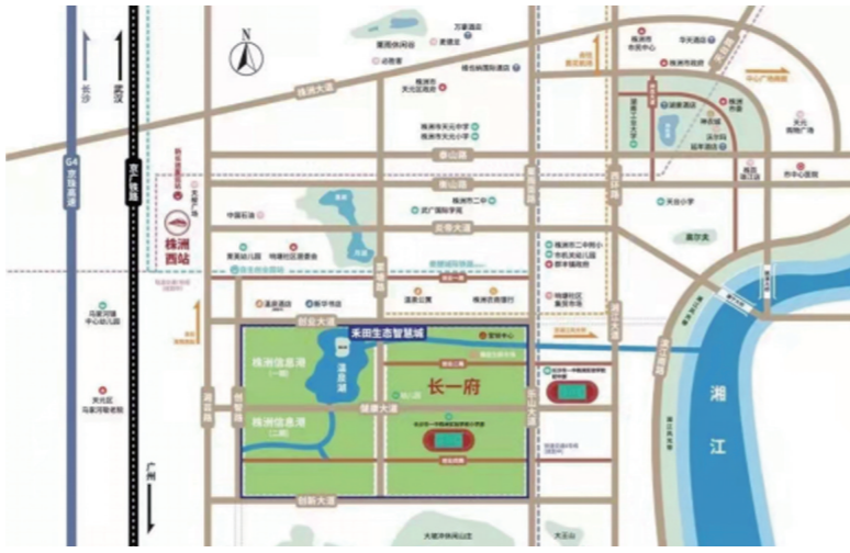
▲禾田生态智慧城·长一府区位图。