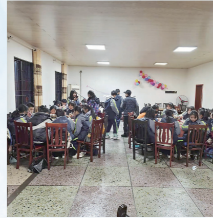
▲老师组织滞留的同学们用餐。