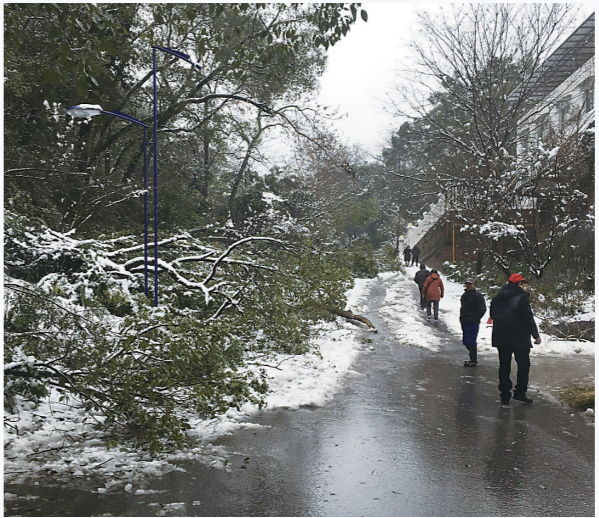
▲石峰公园部分树木被雪压断。

本报讯(株洲晚报融媒体中心记者/刘平)2月23日,石峰公园,多棵树被大雪压断,挡住游道,存在安全隐患... 对此,公园管理人员提醒,石峰公园森林覆盖率高,多处游道蜿蜒、陡峭,路边分布有陡坡。