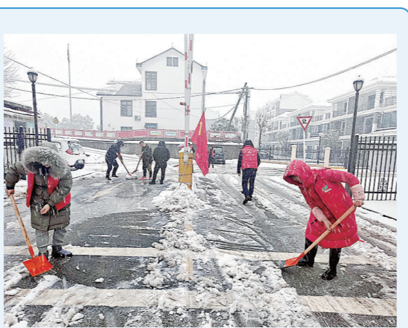
2月22日,株洲经开区龙头铺街道组织党员干部、志愿者共200余人,在辖区主次干道和7个社区,抛撒融雪剂,清扫积雪。

雪天车辆容易打滑,驾车要注意4点:一是油门得踩轻,需要加速时,油门应轻踩,以防驱动轮打滑。二是适当降低车速。低温雨雪天行经山区、桥梁、弯道高速公路时请及时降低车速,警惕路面霜、冰造成打滑。如果能能见度不佳,应遵循相关规定,严格按照限速要求行车。三是切勿急打方向。行车时,双手握住方向盘,尽量保持直行,不随意变道。转弯时方向盘要尽量缓慢一点。不要在弯道中急踩刹车,否则惯性易使车辆失控。四是刹车用“点刹”。刹车时切勿猛踩刹车,要用“点刹”轻踩的方法。