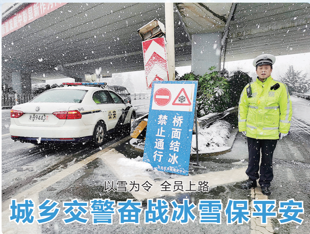
以雪为令 全员上路