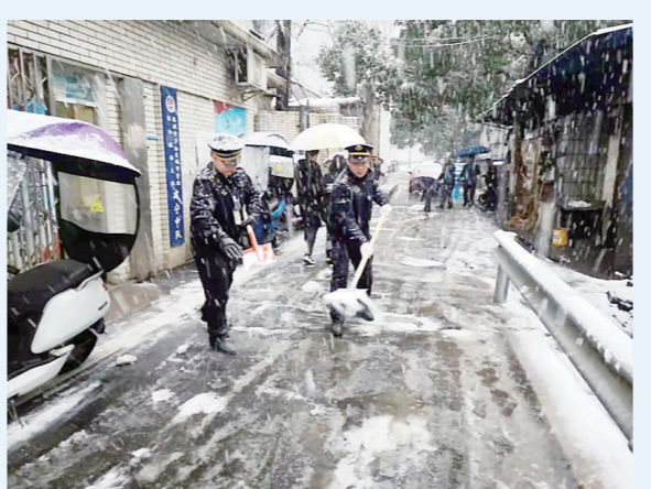
2月22日,芦淞区建宁街道的应急小分队,对辖区马路、街道,进行撒盐除雪作业。