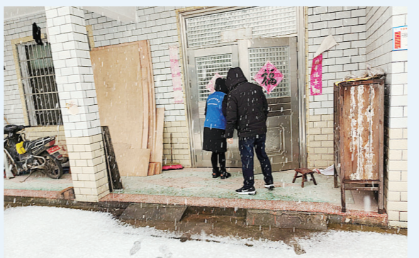
2月22日下午,石峰区霞湾新村网格员冒着大雪,通过走访上门、电话问候等方式,为辖区分散供养人员、独居老人等特殊人群送上问候并提供必要的帮助。