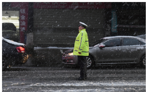
▲红港路,一名交警在雪中执勤。

本报讯(株洲晚报融媒体中心记者/沈全华 通讯员/姚勇 胡胜兰 卜妍 许琳)2月22日,市区大暴雪。市公安局交警支队、省高警局株洲支队全体民辅警以雪为令,科学谋划部署,全员奋战在城乡道路交通安全保第一线,成为雨雪冰冻天气中最美“警”。