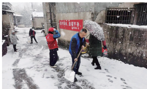
▲映峰社区组织人员铲雪撒盐。

本报讯(株洲晚报融媒体中心记者/周圆 通讯员/马杰 郭维停)雪如期而至,我市网格员们立即行动起来,用实际行动推动基层治理精细化发展,打通为民服务“最后一公里”。