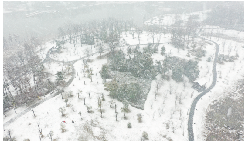
▲2月22日,雪中的神农城白茫茫一片。

根据市气象台昨晚预报,22日20时至23日8时,降雪维持。市区累计降雪量5毫米左右,新增积雪3厘米至5厘米。醴陵、攸县、茶陵降雪量5毫米至8毫米,新增积雪1厘米至5厘米。预计降雪停止时间:市区、醴陵为23日凌晨2时前后,