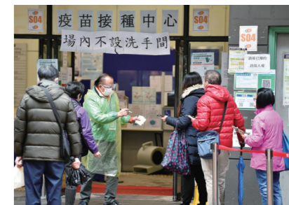
▲香港特区政府卫生署卫生防护中心2月22日公布,截至当日零时,香港新增6211例新冠肺炎确诊病例。图为当日在香港佐敦疫苗接种中心站,市民佩戴口罩排队接种疫苗。