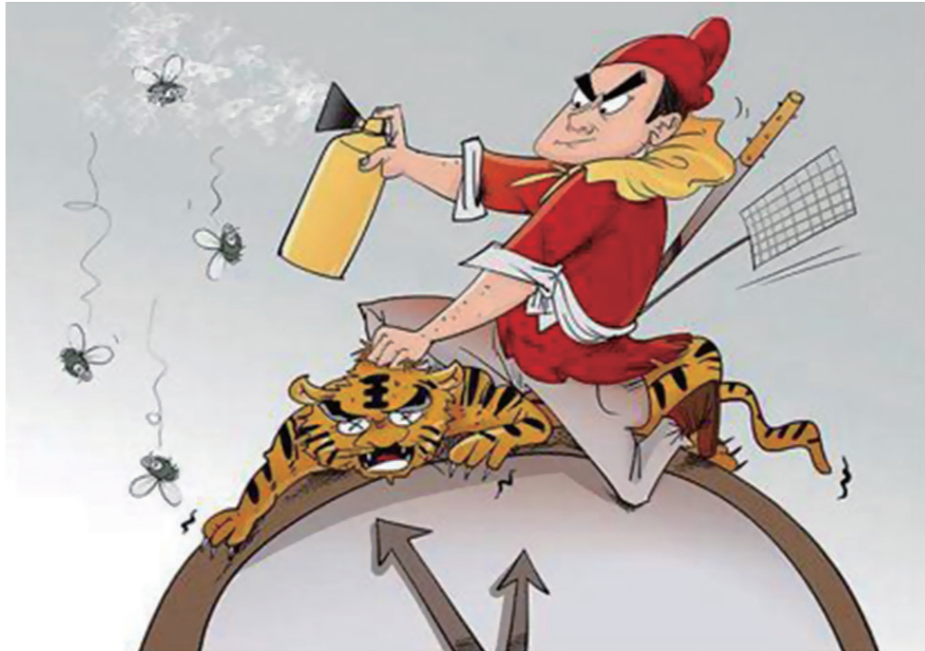
▲漫画《打虎拍蝇》。网络供图