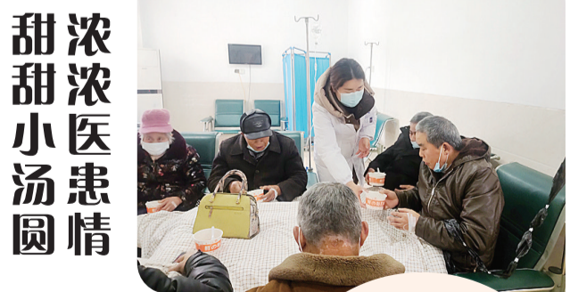
甜甜浓浓小汤圆 浓浓医患情

正月十五元宵佳节,天元区雷打石镇卫生院准备了暖心的小汤圆,送到正在住院就诊的患者身前,祝愿他们早日康复。图为患者围坐一起吃热气腾腾的元宵。