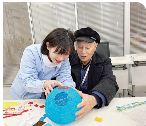
制作灯笼猜灯谜 养老院里欢乐多

现场,青少年朋友为社区居民带来了街舞秀、流行歌曲表演、舞龙灯表演,掌声不断,还有趣味游戏、有奖竞猜、猜灯谜等喜闻乐见的活动,让现场观众乐翻天。当天,株洲新区青年及志愿者们还动手做元宵,送给独居老人、高龄老人、环卫工人等。