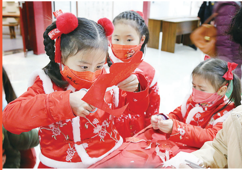
身穿汉服的小朋友正在市文化馆里学习剪纸。