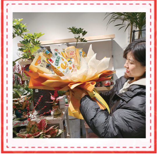
土图花坊,市民预定的零食花束。

“玫瑰价格涨‘上天’,以前一扎(20枝)玫瑰批发价最低40元,最高80元,今年普遍在110元以上,现在最贵的已叫价160元。”2月11日,天元区“洋花堂”花店主王女士说。随着情人节临近,最近几天店里都在积极为节日备货,却发现玫瑰花的进货价水涨船高。 记者走访了株洲鲜花市场,随机询问了七八家商户,得知近期来自云南的玫瑰、桔梗、绣球等鲜花价格涨幅明显,尤其是玫瑰批发价相比去年已经翻倍。 但“贵出天际”的玫瑰花并没有“搅乱”情人节的氛围,一些花店另辟蹊径,推出水果花束、零食花束、蔬菜花束、水果礼盒花束等,销售火爆。