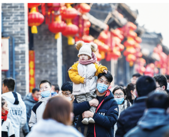
2月8日,游客在平遥古城内参观。春节期间,山西省晋中市平遥古城举办2022“我们的节日·春节——平遥中国年”活动,吸引各地游客前来参观。