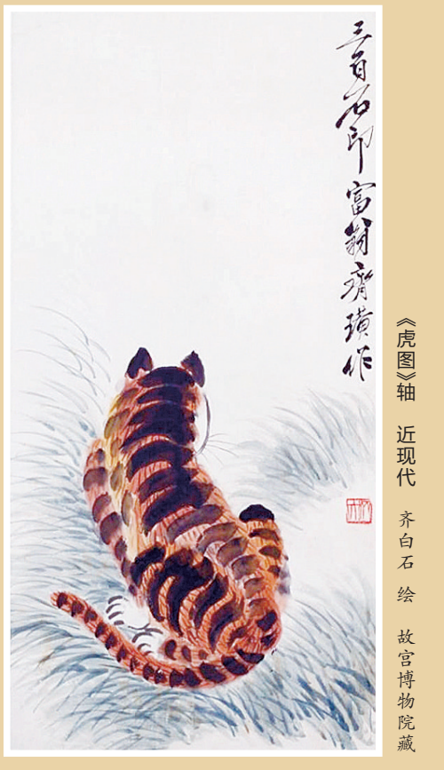
《虎图》轴 近现代 齐白石绘 故宫博物院藏