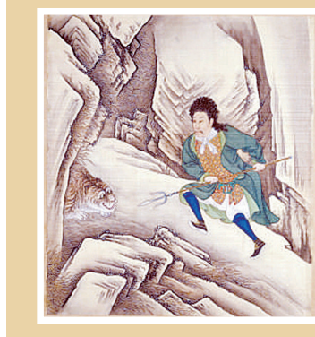
《虎图》轴 近现代 齐白石绘 故宫博物院藏