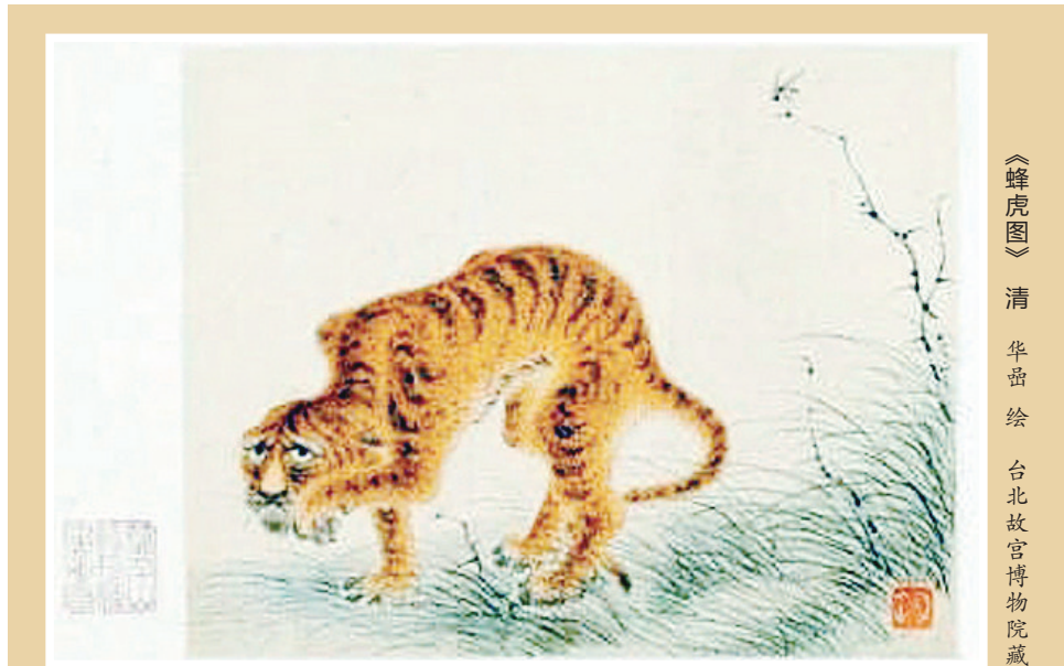
《虎图》清 华岳绘 台北故宫博物院藏

明代锦衣卫中之所以有这么多名画家,是因为当时并未专门设立书画院之类的机构,所以皇帝就把锦衣卫的官职授予一些画家,只有级别和俸禄,并无实职。当然,锦衣卫办案中,也确实需要画师的参与,但很难说有哪个画家实质性参与了锦衣卫的工作。《明史》就记载了明太祖朱元璋大臣宋濂一事。宋濂在家中宴客,锦衣卫把客人相貌、座次、菜肴等都画得清清楚楚。然后朱元璋问宋濂都请了哪些人,宋濂回答无误,算是没有欺骗皇上。