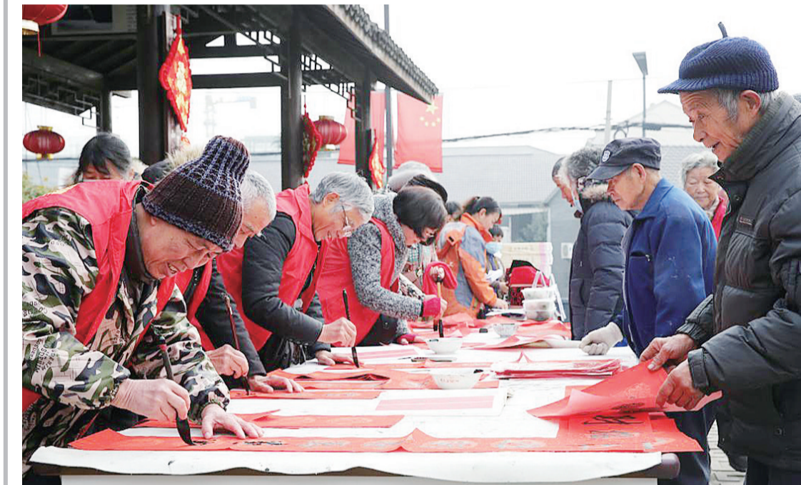
愿者给居民书写春联。1月5日，在浙江省湖州市德清县乾元镇东郊社区，志愿者给居民书写春联。

新华社北京1月23日电 社区服务关系民生、连着民心。 日前，国务院办公厅印发《“十四五”城乡社区服务体系建设规划》，明确了“十四五”时期推进城乡社区服务体系建设指导思想、主要目标、重点任务、组织保障等。 “十四五”时期，城乡社区服务将在哪些方面发力，如何更好解决人民群众操心事、烦心事、揪心事？来看《“十四五”城乡社区服务体系建设规划》三大看点。