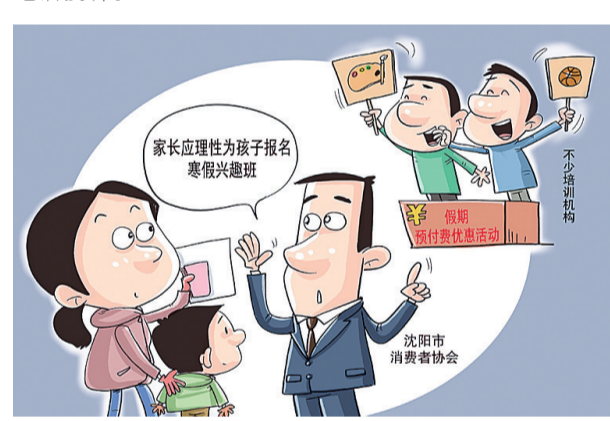
漫画：理性报名 新华社发 王鹏作