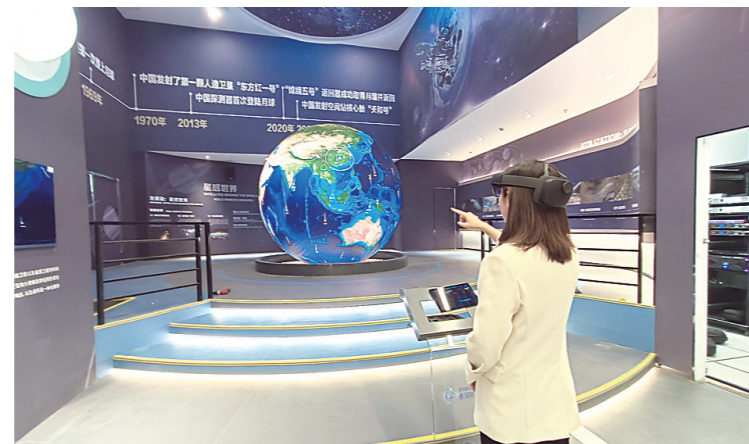
▲去年12月21日,全国首个“直播地球”中心在株洲经开区投运,进一步提升株洲在北斗产业链的影响力。图为参观者用手势识别,体验模拟太空遥感任务。 通讯员/宋律 供图(资料图)

精飞智能北斗低空综合应用示范项目,规划用地面积40亩,总投资约1.6亿元,建设内容包括北斗+无人机技术研究和智能终端研制,北斗+无人机数字农业应用示范、北斗+无人机管控服务示范、北斗+无人物流试点、北斗