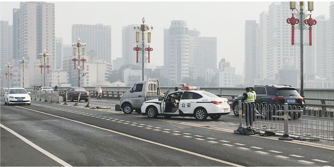
▲事故现场,救援人员在清理现场,恢复交通秩序。

本报讯(株洲晚报融媒体记者/刘平)智轨车道又称为快速公交(智轨专用通道,但过江车辆在株洲大桥的智轨车道上行驶千万不能车速过快。