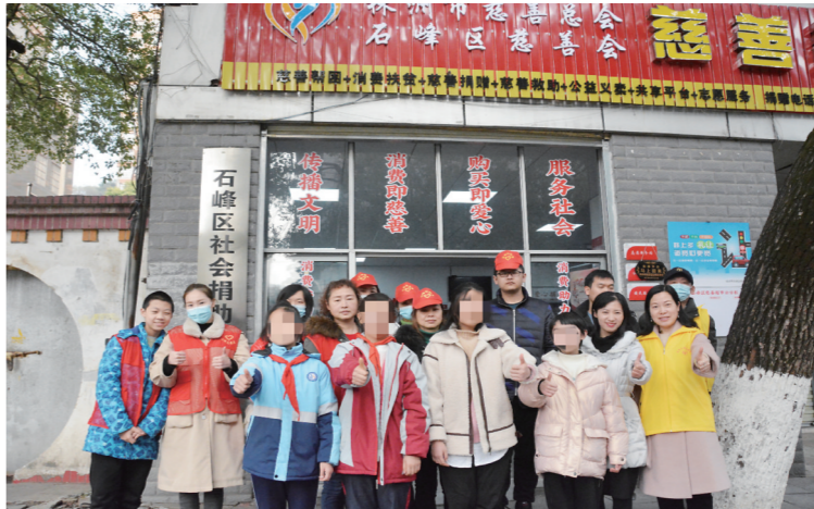
▲石峰区志愿者和部分学生合影。