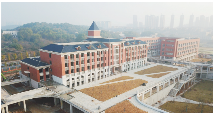
▲航拍建设中的枫溪学校。

本报讯(株洲晚报融媒体中心记者/戴凇)枫溪学校何时能够建成投用?连日来,本报接到不少市民来电咨询。记者昨日从多部门获悉,新学校有望在今年秋季投入使用,办学性质为公办。