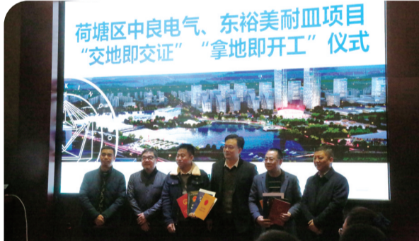
▲荷塘区中良电气、东裕美耐皿项目“交地即交证”“拿地即开工”仪式。

“非常感谢荷塘区产业项目建设‘帮代办’服务,通过业务专岗、服务专员,帮办+代办的无偿服务,有效解决项目行政审批流程不畅的‘堵点’,提供项目建设要素保障。”近日,荷塘产业开发区内中大型机械项目的吴总就项目建设推进顺利感到无比欣慰,连连称赞。