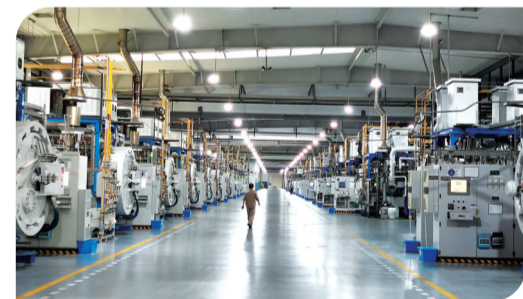
▲荷塘区一家先进硬质材料企业内景。

2020年3月,株洲先进硬质材料产业集群发展促进中心成立。在促进中心的推动下,株洲先进硬质材料工业互联网平台一期于2021年9月搭建完成,并先后举办或组织集群企业参加了“中国钨产业市场与应用高峰论坛暨中国硬质合金市场应用研讨会”、“中国先进材料产业创新与发展大会先进硬质材料产业论坛”、东莞刀协交流活动、株洲·东莞产业对接会,行业交流更密切。