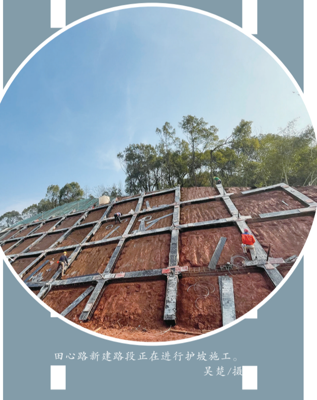
田心路新建路段正在进行护坡施工。

“比如挖着挖着就遇到不明管线,有一次顶管施工,往北挖碰到燃气管,往南顶又是电气管,为保险起见,很多时候只能使用最传统的人工作业。”施工方市城发集团相关负责人说,眼下工人节假日通宵施工已是常态。