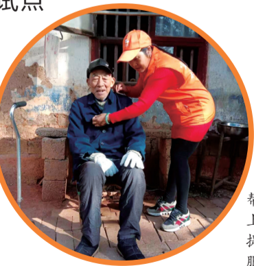
▲“友邻帮”服务人员上门为老人提供“助护”服务。

巨轮在滚动,2021年6月,先进硬质材料交易市场开工建设。荷塘区已引进韵达物流、顺丰物流项目,三一智慧钢铁铁路专线正式开工。特别是数字物流发展迅猛,国联捷物流公司成为交通运输部“网络货运平台”企业。