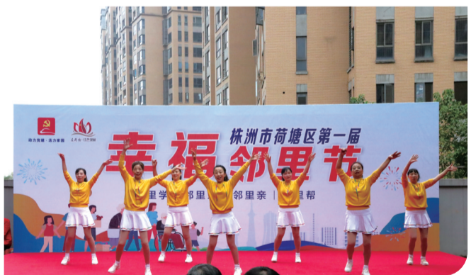
▲株洲市荷塘区第一届幸福邻里节活动现场。

改革不停,创新不止。2021年以来,荷塘区始终坚持改革创新,按照“聚焦、裂变、创新、升级、品牌”工作思路,深入践行新发展理念,持续以深化供给侧结构性改革为主线,坚持问题和需求导向,着眼于破除制约发展的障碍,为建设“一区两城”(争当基层治理先行区,建设材料科技城、现代物流城),提供动力源泉和制度保障。