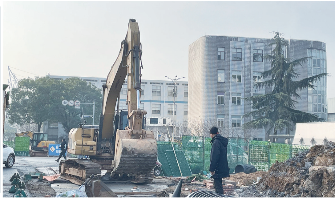
田心路中车株机北大门节点春节前通车。

田心路,田心片区的“动脉”。作为株洲城市更新行动的开篇之作,此路自去年改扩建以来备受市民关注,目前进展如何?交通状况将如何改善?