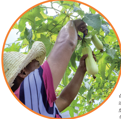
▲2021年,白关丝瓜产值近6亿元。图为瓜农正在采摘当季丝瓜。

聚焦实效,久久为功。新时代改革大潮激荡,站在新的起点上,芦淞区持续加大改革力度,释放改革红利,惠及人民群众,凝聚起高质量发展的磅礴力量,书写壮丽篇章。