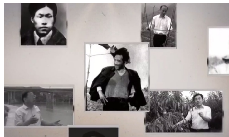
焦裕禄精神的新时代回响。