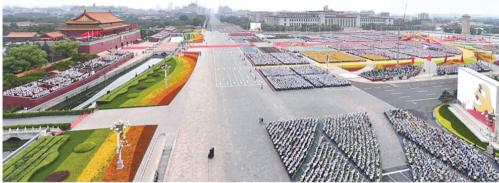
2021年7月1日,庆祝中国共产党成立100周年大会在北京天安门广场隆重举行。

每一个辞旧迎新的时刻,都让人心潮澎湃。庄严深沉的钟声响彻时空,向我们党带领人民走过的百年征程深深致敬。清脆悦耳的钟声饱含深情,为我们共同拼搏的2021画上圆满的句号。山水万程,步履不停。过去一年,中国“牛”苦干实干、稳扎稳打,耕耘神州大地,收获累累硕果。新的一年,中国“虎”气势如虹,勇毅笃行,在广阔天地跃跃纵横,必定大有作为。