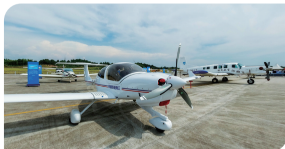
▲低空旅游专线飞机在芦淞通用机场等待起飞。

2021年9月22日,《湖南部分区域低空空域空管协调运行保障协议》低空空域试点确定的5个试运