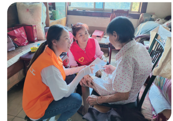
▲芦淞志愿者上门开展精准服务。

人民有所呼,改革有所应。芦淞区深化“一件事一次办”改革,加强“互联网+政务服务”改革成果运用,率先在全市实现“跨省(域)通办”,省第三批296件“一件事一次办”区级权限事项100%一窗统办、区域通办,罗莎蛋糕成为全市“拿地即开工”示范项目。