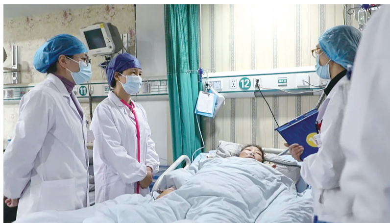
在外工作的醴陵籍医专家回醴陵参加义诊。