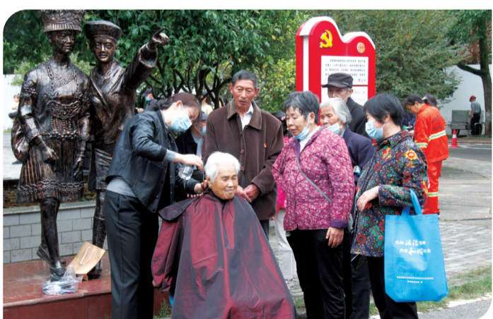
▲芦淞区党员服务进社区,为居民义务理发。

岁月如歌,追梦前行。2021年以来,芦淞区全面贯彻中央、省委、市委关于深化改革各项决策部署,围绕全面落实“三高四新”战略定位和使命任务,以推动高质量发展为主题,以解决人民群众急难愁盼问题为导向,推动改革和发展深度融合、高效联动,出台6大类、75项具体改革任务及十大重点改革,各项改革事业在芦淞落地生根、取得实效。