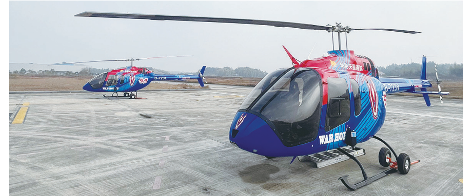
两架高性能直升机进驻株洲芦淞通用机场。

株洲日报·掌上株洲讯(记者/杨凌凌 通讯员/罗金鹏) 1月11日下午,随着两架Bell 505直升机的顺利降落,株洲芦淞通用机场又多了两架高性能直升机。