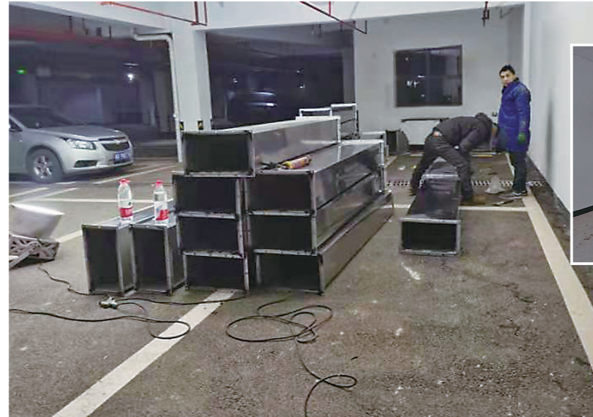
▲地下车库里搭建的房屋已基本建成。