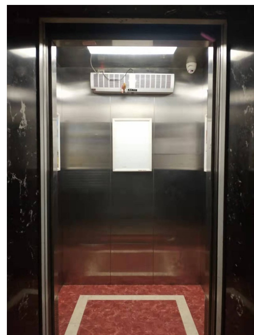
▲辉煌时代小区1栋1单元电梯多次出现故障。

宁立涌认为,要确保电梯使用安全,维保单位要确保维保质量,业主、物业工作人员要加强对维保单位的监督,物业公司要发挥好日常管理的角色,业主主要规范使用电梯,杜绝人为破坏,与电梯监管有关的相关部门要加强监管和执法力度。