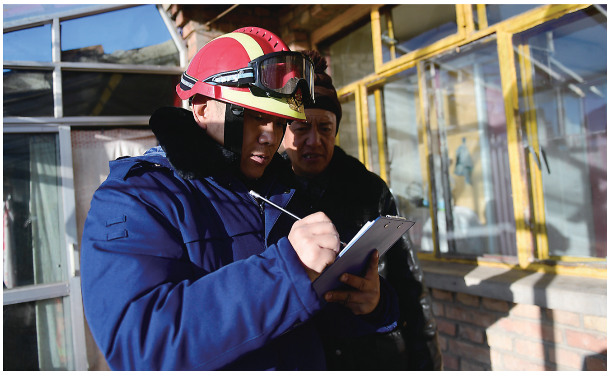
1月8日,在青海省海北藏族自治州门源回族自治县皇城蒙古族乡西滩村,海北州消防救援支队队员在入户排查。

据新华社西宁1月8日电 1月8日1时45分,青海省海北藏族自治州门源回族自治县发生6.9级地震,震源深度10公里。震中10公里范围内平均海拔约3659米,人口稀疏。记者从门源县相关部门获悉,本次地震共有4人受伤(均为避险途中擦伤),目前轻伤者经过医疗处理后已返回家中。