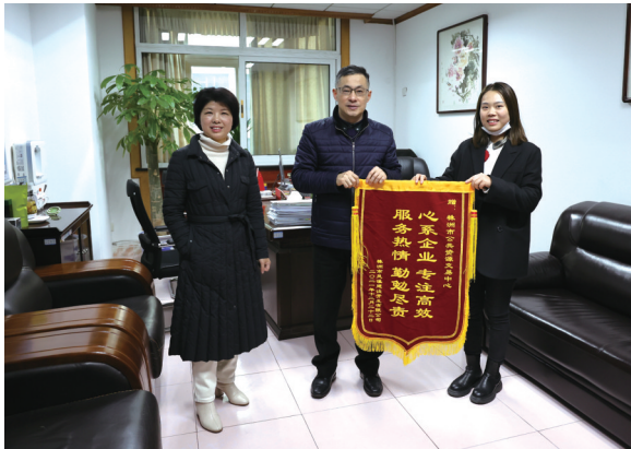
株洲市凤溪建设开发公司为中心送来锦旗。

2021年,我中心土地使用权出让交易成绩傲人,土地挂牌出让成交建设用地使用权项目300宗,比上年同期增加了27宗,上升了9.89%,成交金额268.06亿元,比上年同期增加了7.04亿元,上升了2.7%;协议出让36宗,成交金额6.44亿元;排污水交易项目138宗,成交金额439.18万元。全年累计国有建设用地使用权减免交易