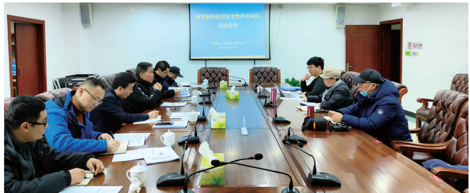
商用密码应用安全性评估项目启动会议。

为贯彻落实《中华人民共和国密码法》按照市国家密码管理局有关通知文件要求,2021年株洲市公共资源交易中心(以下简称“株洲中心”)积极推进“株洲市公共资源电子交易系统”、“株洲市土地和矿业权交易系统”两个等保三级系统的商用密码应用与安全性评估(以下简称“密评”)工作。12月13日中心通过询价采购的方式确定了长沙中安密码检测有限公司为中心商用密码应用与安全性评估机构,为密评工作的开展打下了坚实的基础。