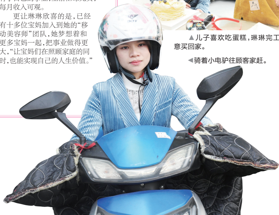
◀骑着小电驴往顾客家赶。