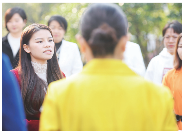
▲琳琳与新加入团队的宝妈交流。