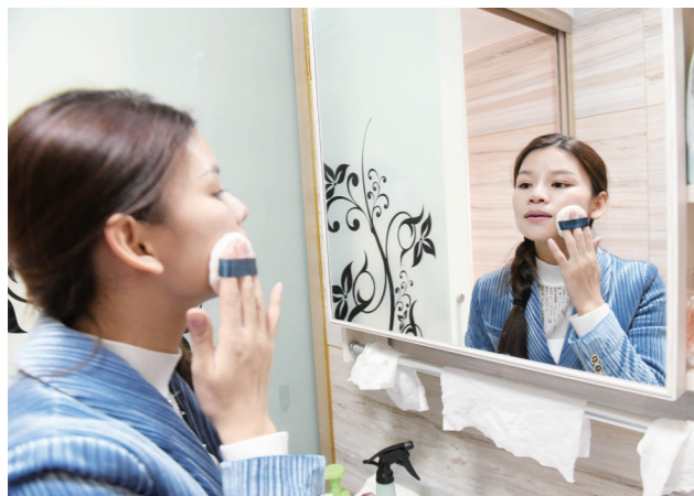
▲外出工作前,把自己打扮得美美的。