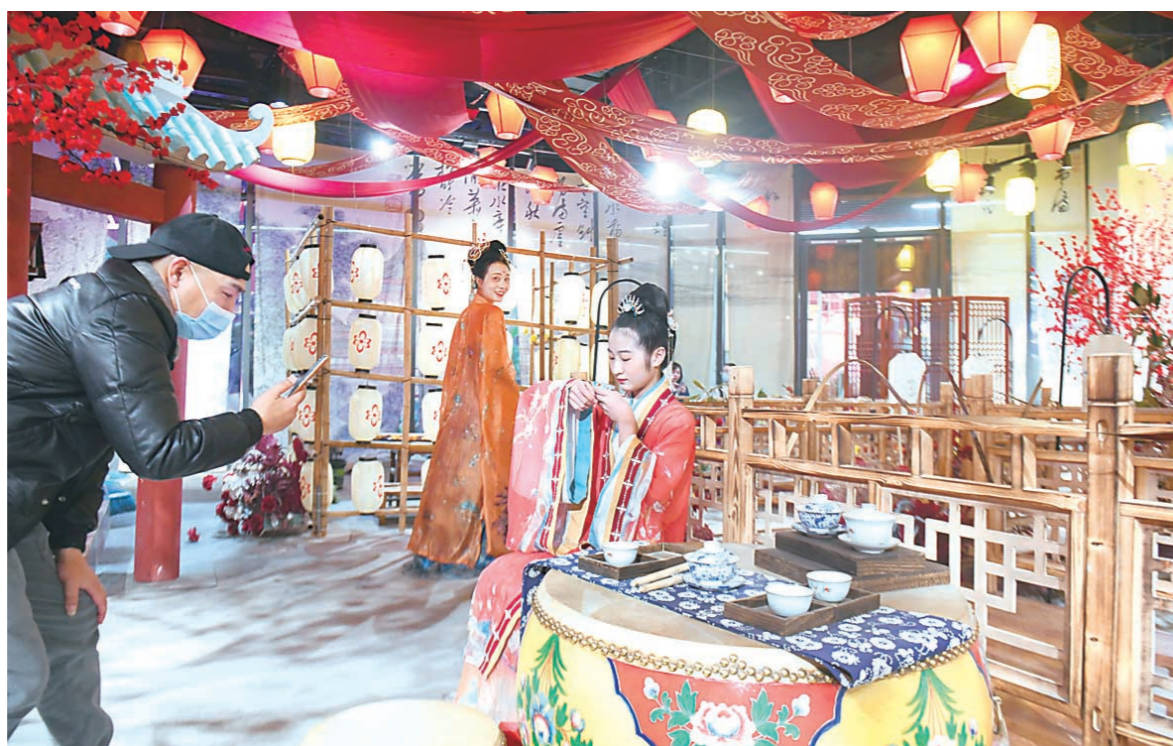
▲1月2日,长江广场,市民在品尝美食、体验传统文化,享受美好的假期。