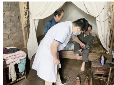
▲市三三一医院医生上门集中评残。

芦淞区残联在签收交办函后,召开了整改会议。一方面,将评残费用由原来的80元降至58.8元。另一方面优化评残流程,提升服务水平。坚持就近和就便原则,灵活开展集中评残和上门评残。