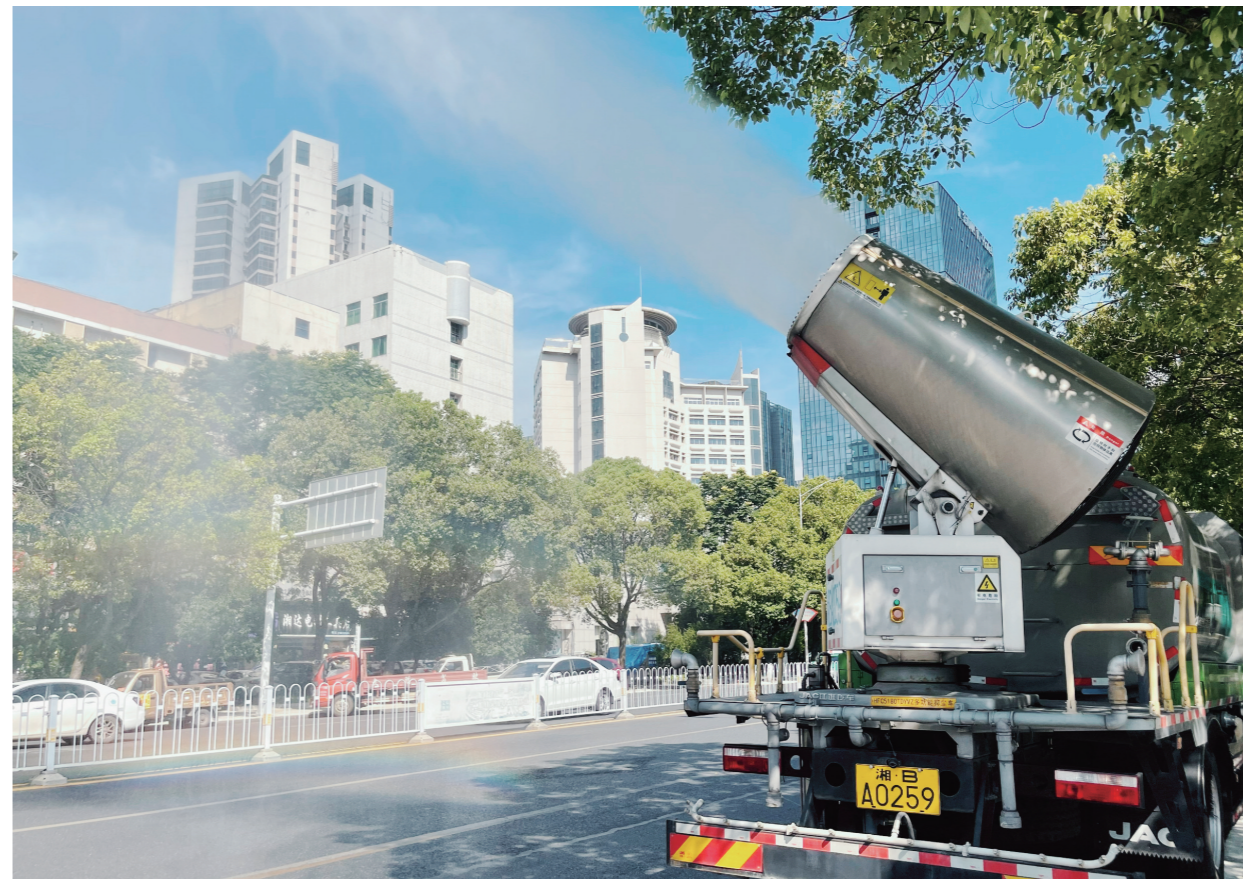
▲环卫机械化效率提升,雾炮车高效洒水降尘。

据悉,自2020年巡察整改以来,芦淞区残联对全区疑似残疾未办理人员进行全面摸排,并新办证544人,开展集中评残7次,评残400余人。为重度肢体、精智残疾对象开展上门评残11次,评残120余人次。