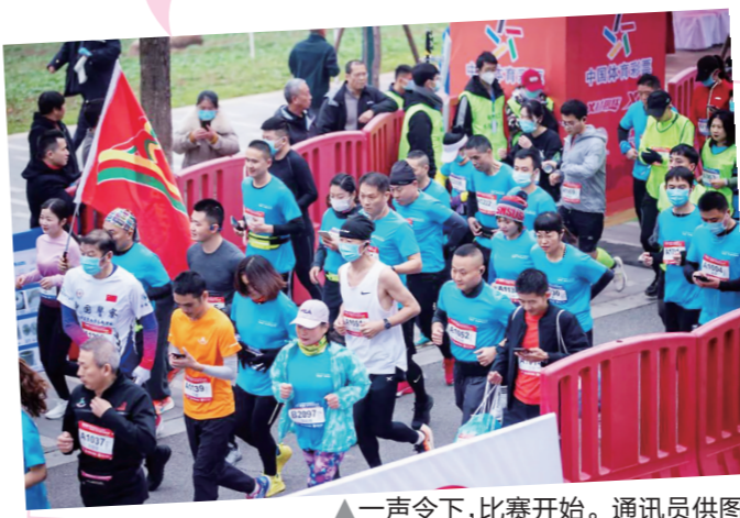
▲一声令下,比赛开始。

本报讯(株洲晚报融媒体中心/王鸿通讯员/陈海波)1月1日上午,2022中国体育彩票第八届株洲元旦迎新“特科能”杯半程马拉松赛在河西四桥风光带开跑,800多名跑步爱好者参加了比赛。