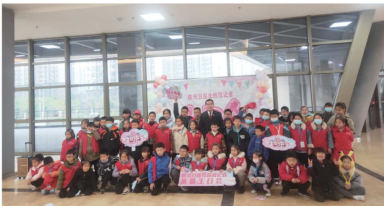
▲株洲日报社校园记者生日会现场。

本报讯(辅导老师/王卫平)暖场小游戏后,校园记者表演一场场有关学生安全防护的情景剧……2021年12月25日,株洲日报社校园记者俱乐部在妇女儿童活动中心举办主题生日会。