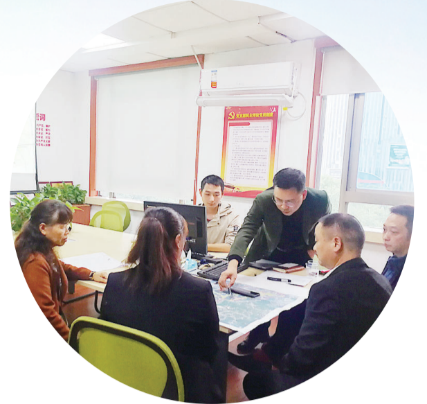
邀约村民参与征求意见。